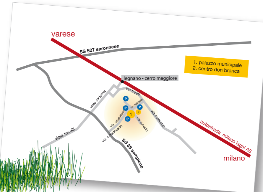
progetto grafico: ivano.bollati.2010